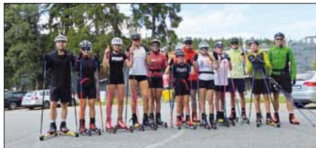
Soustředění ve Vysočina aréně 2025

Kdo by se k nám chtěl přidat, tak náborový trénink je každé pondělí v 17 hod. na hřišti u ZŠ Zubří.