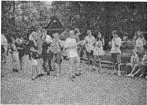
Na snímku: Německé a zuberské děti v rožnovském muzeu