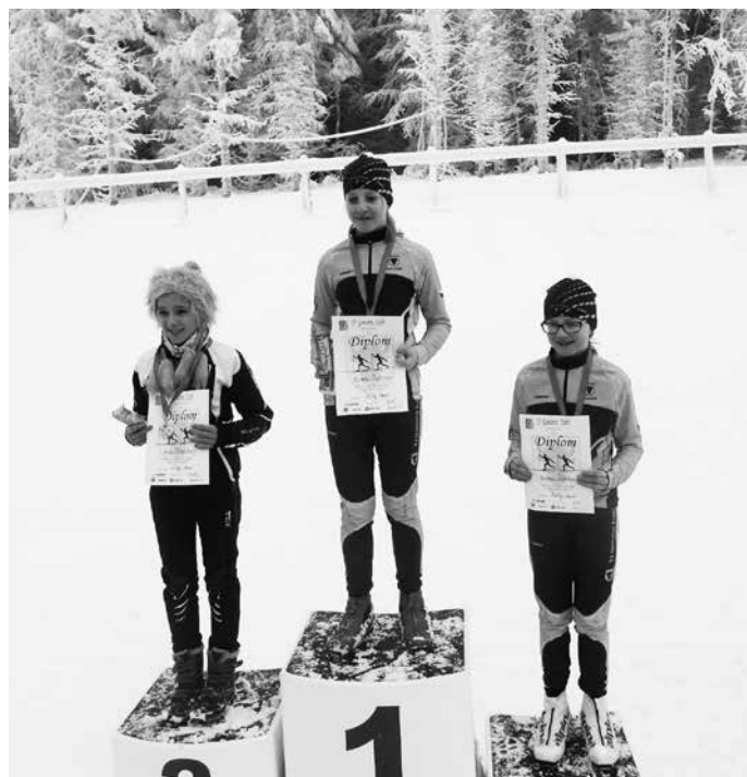
Krajský závod na Pustevnách, kat. starší žačky:

První únorovou sobotu uspořádal lyžařský oddíl TJ Gumárny Zubří Krajský závod v klasickém lyžování. Již tradičně byly zvoleny závodní tratě v Běžeckém areálu Pustevny, kde byli závodníci rozděleni do třinácti věkových kategorií a vysláni na tratě v délkách od 800 metrů po 10 km. Sněhové podmínky konečně umožnily „urolobovat“ tratě v plném rozsahu, a poprvé v sezóně se tak na Pustevnách lyžovalo na nezkrácených okruzích. Závod se konal v náhradním termínu, protože zima si letos dala na čas a v původním lednovém termínu nebyl ani na Pustevnách sníh. Skvělou zprávou je, že ze zuberské výpravy se hned sedm závodníků postavilo na stupně vítězů.