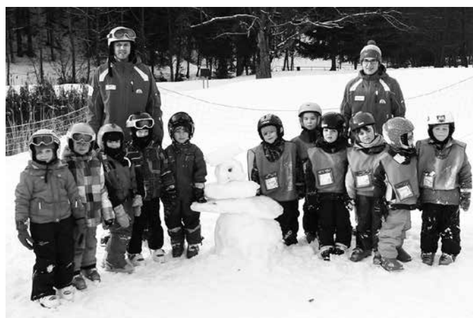
Gepardi a Panteři

To vám bylo tak. MŠ Duha pořádá každoročně spoustu aktivit pro naše děti, kurz lyžování však doposud ne. Slovo dalo slovo a také u nás jsme se chystali na I. ročník lyžařského kurzu pro děti od 4 let. S naší skupinkou 24 dětí jsme spolu s dětmi z MŠ a ZŠ Hutisko-Solanec rozjízďeli také I. ročník lyžování se strašidýlkem Razulákem ve skiareálu Razula ve Velkých Karlovicích. Zde, na svahu pod hotelem Horal, na super sjezdovce pro začínající lyžaře, má společnost SUN Outdoor vybudován od letoška nový dětský snow-park, který nám byl po dobu týdenního kurzu zcela k dispozici. Tak už víte, jak to všechno začalo. Chcete vědět, jak to bylo dál?