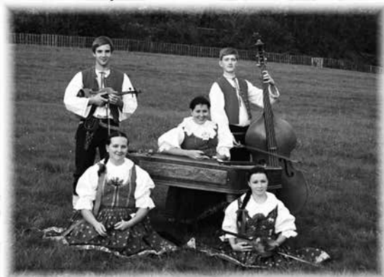
Cimbálová muzika Malý Beskyd

Zkoušíme každý pátek od 17:00 v Klubu Zubří.