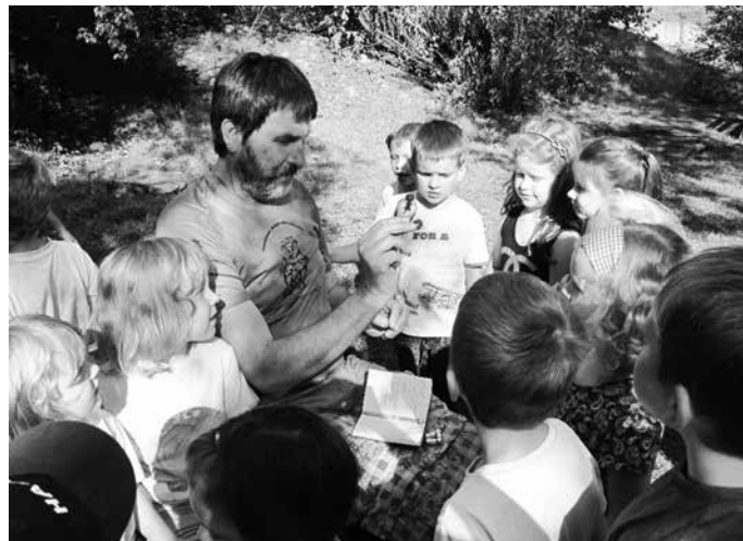
Středisko volného času Valašské Meziříčí, výchovně vzdělávací program „ODLET PTÁKŮ“