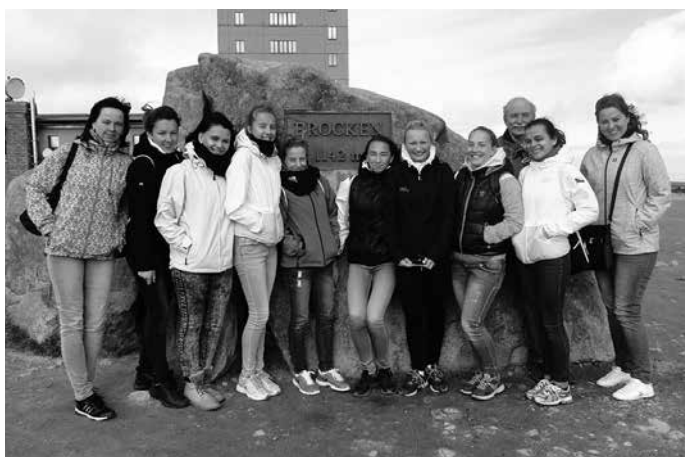
Fotografie z túry na nejvyšší horu Harzu - Brocken (1142 m n.m.) - bylo větrno a chladno.

Družstvo juniorek moderní gymnastiky Zubří se ve dnech 23. - 28. 9. 2015 poprvé vydalo na družební návštěvu do Rosdorfu. Kromě poznání družebního města, stromu přátelství a příjemných lidí se podařilo trenérkám a gymnastkám seznámit se s gymnastickým děním v Rosdorfu a v blízkém městečku Obernjese. Společný trénink obohatil obě strany a vystoupení našich děvčat zatajilo dech nejednomu divákovi. Ohlasy byly velké a příjemné. Již teď se těšíme na další setkání, které by mělo proběhnout zase u nás v Zubří. Poděkování patří nejen Městu Zubří a paní učitelce Lence Molišové za přípravu pobytu, ale také celému organizačnímu týmu v Rosdorfu, který měl zuberské gymnastky na starost ubytováním počínajíc a naplněným a velmi krásným programem konče. Poděkování patří především panu Klausovi Hampemu a Wernerovi Wiedekampovi.