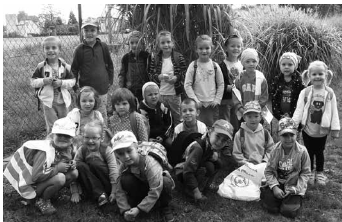
Kolektiv MŠ Duha