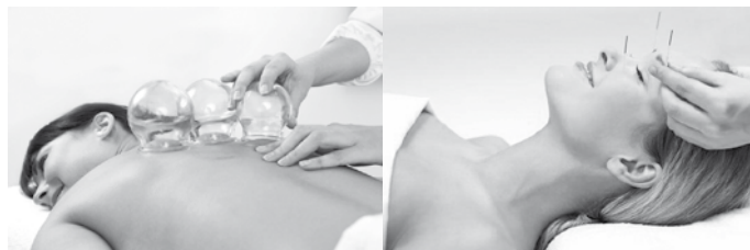
Ilustrační obrázky – terapie: baňkování, akupunktura

V rámci přednášky vám budou představeny možné přístupy a terapie řešící určité problémy. Většina z nich prochází přes emoční stránku člověka. Strach, Zloba, Návist, Hněv, Beznaděj,... které se ukrývají hluboko, způsobují onemocnění, se kterými si doktoři nevědí rady. Řeč bude např. o akupunktuře, lymfatické masáži, psychoterapii, očistě organismu a dalších možnostech terapie.