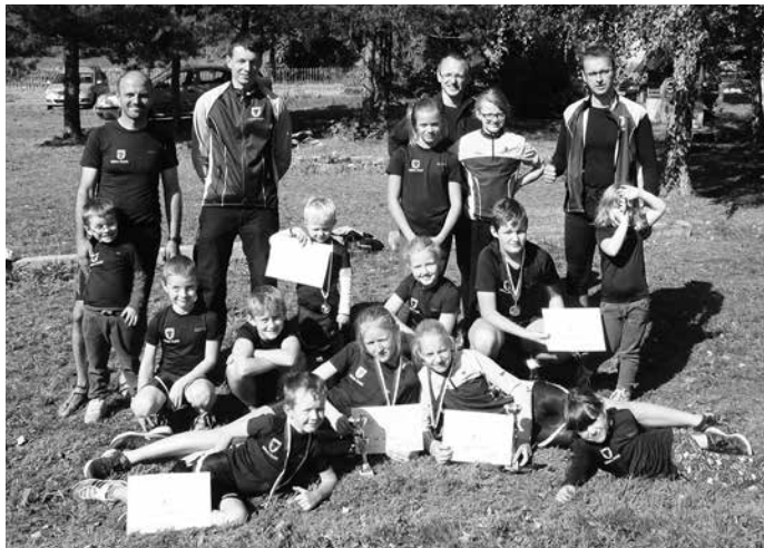
Běh údolím Kněhyně byl pro náš oddíl velmi úspěšný

Tradiční podzimní lyžařské „přespoláky“ jsou letos ve Zlínském kraji minulostí. Na zuberský Běh okolo Soliska navázaly o dalších víkendech závody ve Valašském Meziříčí, Kněhyni a v Rožnově pod Radhoštěm. Naše krajské závody jsme doplnili účastí ve Frenštátě závodem v okolí frenštátských můstků a ještě se chystáme poslední říjnovou sobotu do Veřovic. Velmi úspěšně jsme v říjnu zakončili celoroční seriál závodů v běhu pod názvem Frenštátský běžecký pohár. Všem pořadatelům závodů jistě udělala radost vysoká účast a počasí bez deště. Závody si tak užívali nejen běžci, ale i diváci a fanoušci.