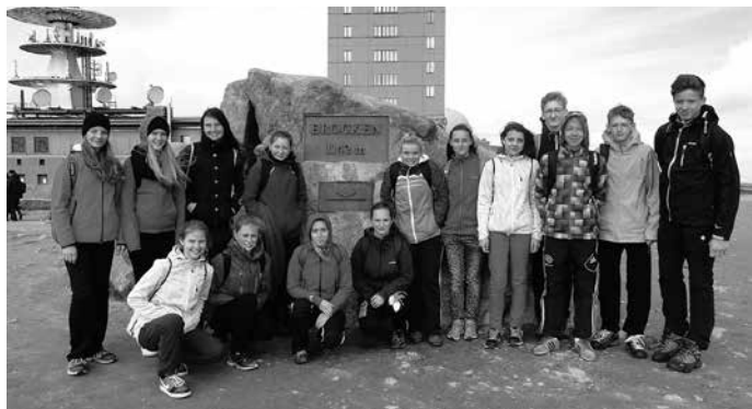
Brocken - pohoří Harz