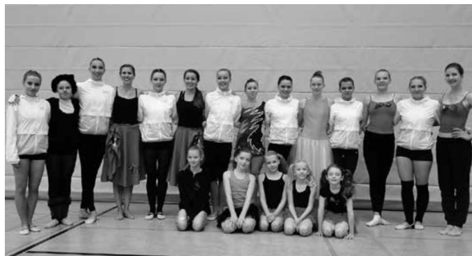
Společné foto ze sobotního vystoupení gymnastek ze Zubří a Obernjesy

Ve středu 23. září jsme se v nekřesťanských ranních hodinách vydaly všemožnými dopravními prostředky na velmi dlouhou cestu ze Zubří do Rosdorfu. Když jsme dorazily na místo, nadšeně nás přivítali němečtí organizátoři, kteří se o nás po celou dobu pobytu svědomitě starali. A stejně jako ostatní obyvatelé Rosdorfu na nás byli moc milí. Absolvovaly jsme společnou večeři a poté jsme se rozjely do našich hostitelských rodin. Rychle jsme se s nimi seznámily a skamarádily. Mluvili jsme s nimi anglicky i německy, takže naše paní učitelky budou mít jistě radost z našich pokroků. Za tu krátkou dobu, co jsme v Německu pobývaly, jsme stihly parním vláčkem dojet na nejvyšší horu Harzu Brocken, projít si historické město Göttingen a vydovádět se v aquaparku plném tobogánů a atrakcí.