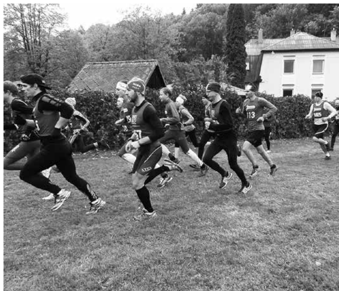
Start kategorie - Muži v závodu Běh okolo Hradiska