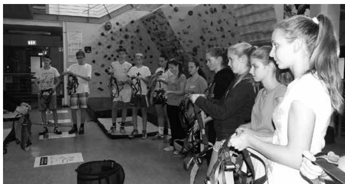
Návštěva lezecké stěny v Göttingenu