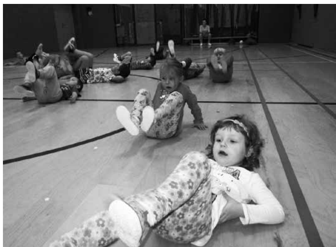
Poprvé v Sokolovně - cvičíme pro radost