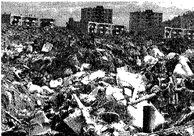
Fotomontáž : Pavel Czinege