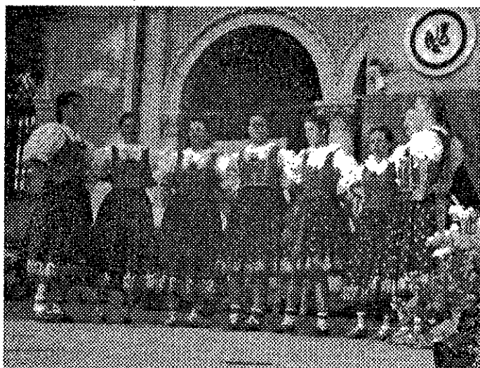
"Ogaři, tyto cěrky na vás čekají!"

Přijímáme hlavně kluky ve věku od 15 let do 25 let. Naším děvčatům chybí tanečníci a čekají na Vás. Přijďte proto 29. 10. 1993 v 20.00 hodin do klubu v Zubří (hlavního sálu) na seznamovací zkoušku.