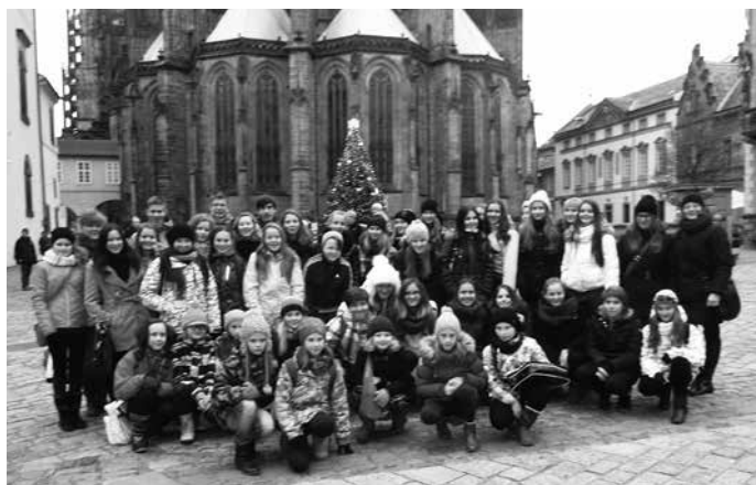
Stonožkové děti ze Zubří na nádvoří Pražského hradu

Po třinácté hodině se tři vybraní žáci přesunuli do Arcibiskupského paláce na předávání cen za obrázky. Ostatní se mezitím seznámili s památkami blízko chrámu – s bazilikou sv. Jiří a Starým královským palácem. Tam jsme si hlavně prohlédli Vladislavský sál. V minulosti byl používán jako místo pro rytířské turnaje i korunovační hostiny. Dnes se ale používá např. na slavnostní zasedání Parlamentu.