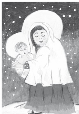
Zuzana Galčanová, 14 let, ZŠ Zubří

Vánoce jsou v naší společnosti stále oblíbenými svátky. I když si už pod tímto svátkem nepředstavujeme všichni totéž. Hlavní náplní Vánoc je radost z dítěte. Radost z narození dítěte, které už na začátku svého života upoutalo