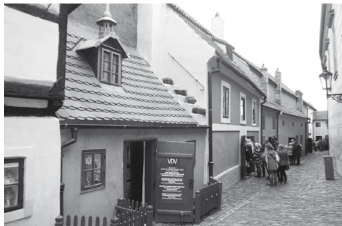
Návštěva Zlaté uličky