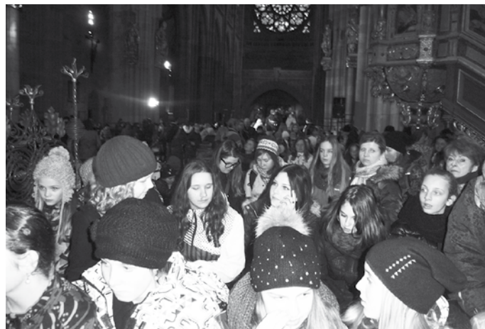
Při bohoslužbě v Katedrále sv. Víta