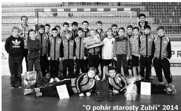
"O pohár starosty Zubří" 2014