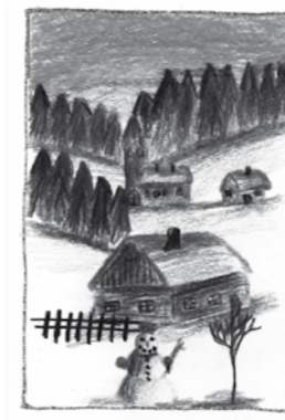
Dominika Sváková, 14 let

Opět po roce jsou tu Vánoce a k tomu pohádky stojí už za vratky. Všude je bílý sníh a bez růží zahrádky, na stromě sedí černý kos a zmrzlé má pařátky.