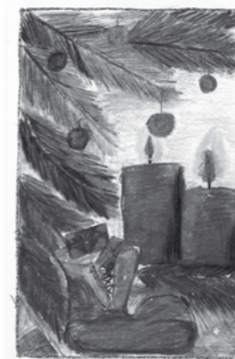
Michaela Polášková, 13 let