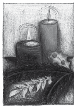
Nikola Krupová, 14 let