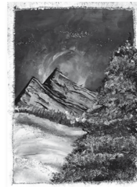
Matyáš Juríček, 14 let