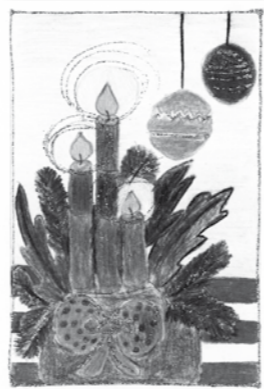
Barbora Urbanová, 13 let

V lese pobíhá zlaté prasátko, uvidí ho třeba i malé dětátko, nesmíme však nic do pusy dát, než první hvězdička začne plát.