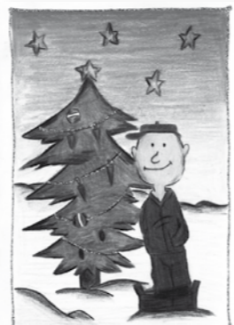
Barbora Cábová, 13 let