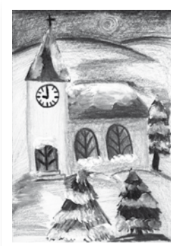
Kamila Trojáková, 13 let