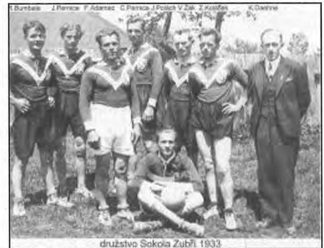
Družstvo SOKOL Zubří v roce 1933