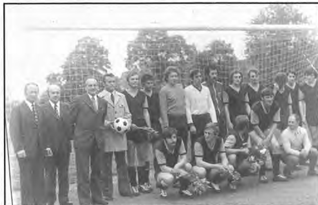
Po utkání, po kterém jsme postoupili do I.A třídy 1975 - 1976