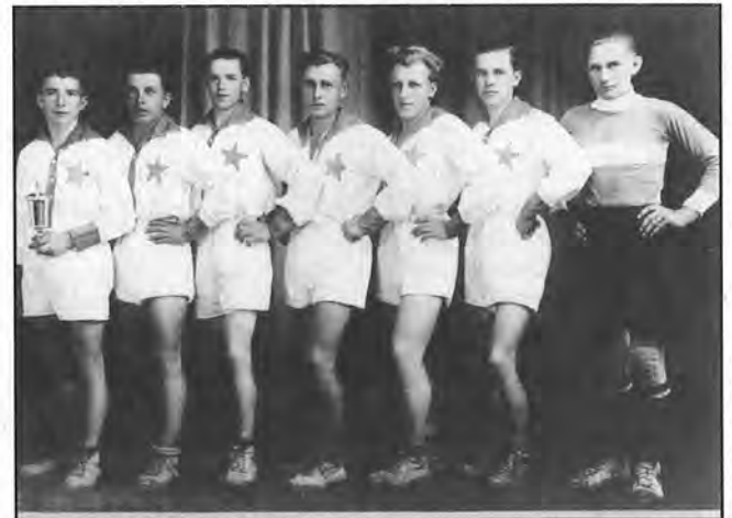
Družstvo OREL Zubří

Z archivních dokumentů je známo, že se v Zubří hrála házená již v roce 1926. Nejprve živelně, pak si jednotlivé oddíly měřily síly mezi sebou. A tak jen díky vzpomínkám a zápiskům nejstarších pamětníků nám údaje prozrazují, že zuberští házenkáři hráli v roce 1927 v Krhové proti Orlu. Družstvo bylo složeno ze všech místních oddílů.