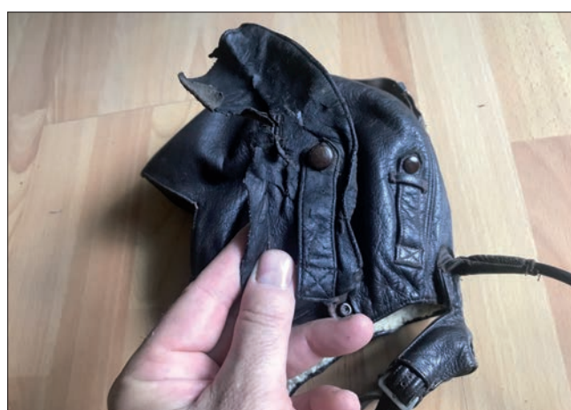
Část pilotní kukly LKpW 101