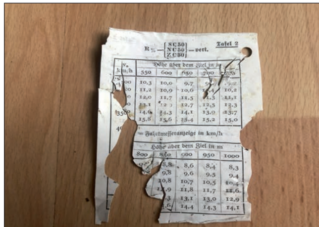
Plastový štítek - nastavení