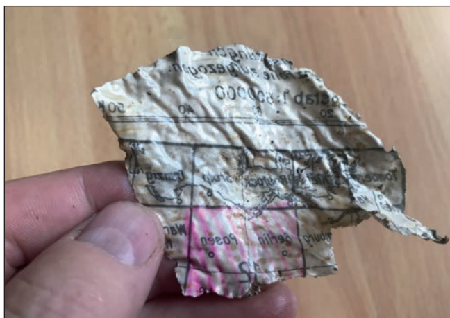
Část projekční mapy zaměřovače Lotfe