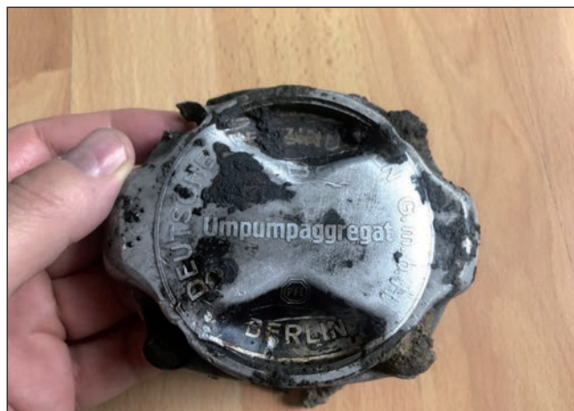
Část benzinového čerpadla