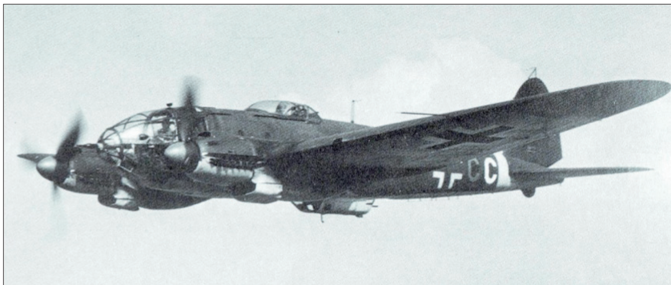
Ilustrační snímek He 111H