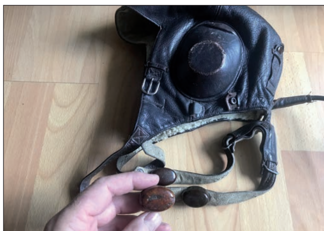
Hrdelní mikrofon z kukly