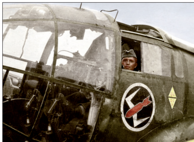
Znak III. Gruppe KG 53