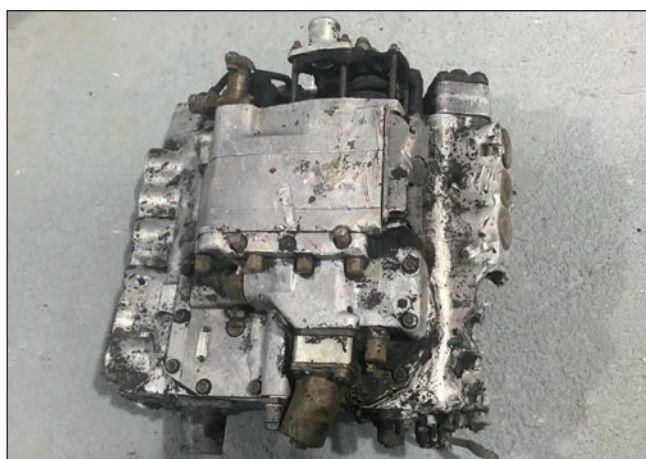
Vstříkovací čerpadlo motoru JUMO 211F