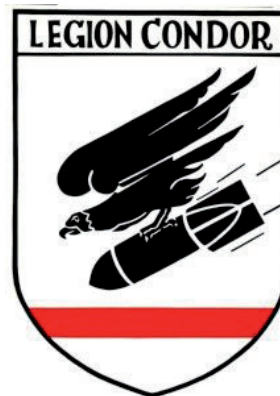
Znak KG 53 "Legion Condor"

III. Gruppe KG 53, ke které havarovaný letoun patřil, vznikla 1. května 1939. Během Bitvy o Británii byla nasazena na francouzské základně Lille-Mouvaux. Později byla nasazena na východní frontě v tažení proti Sovětskému svazu. Dle německých záznamů byla od 19. července 1943 dislokována na německé základně Gablingen u Augsburgu, kde se přezbrojovala. Její stroje byly v průběhu listopadu a začátkem prosince 1943 přelétávány zpět na východní frontu, což přesně zapadá do časového rámce letecké katastrofy u Zubří. Od 5. prosince již byla jednotka deklarována jako bojeschopná na základnách na východě. Lze tedy s velkou jistotou konstatovat, že zřícený letoun startoval ze základny Gablingen a jeho cílem bylo některé z letišť v Sovětském svazu.