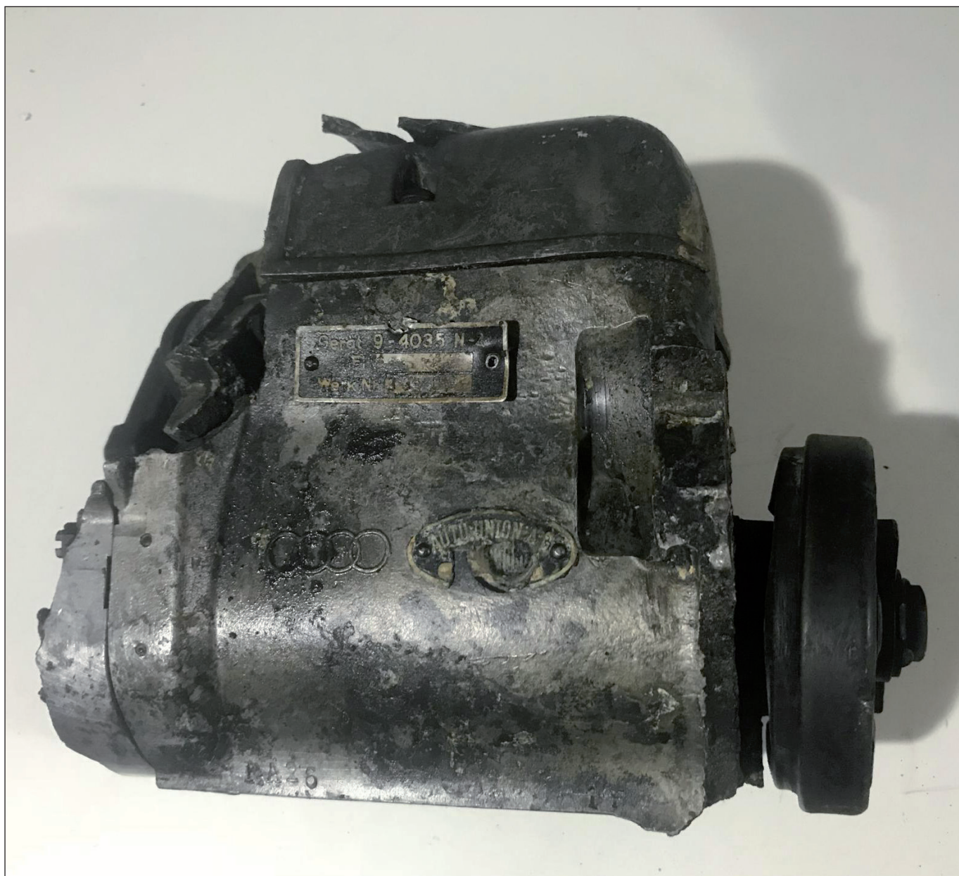
Zapalovací magneto - výroba AUTOUNION A. G., od r. 1964 přejmenováno na AUDI