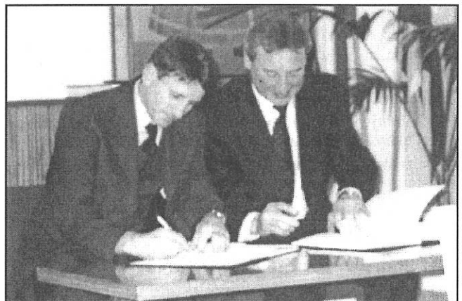
Starostové obou obcí při podpisu smlouvy