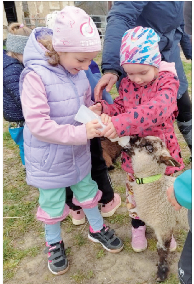
Sluníčka MŠ Sídliště

V úterý 14. dubna jsme nasedli do autobusu a vyrazili se Sluníčky na nedaleký statek Branky. Užili jsme si nádherný den plný smíchu a zvířat. Děti si vyzkoušely krmení jehňátek, česání oveček a ježdění na konících. Už teď se společně těšíme na další výlet.