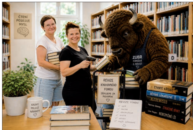
Výgenerováno pomocí AI

Možná jste si v dubnu všimli, že naše knihovna na chvíli zmizela z běžného provozu. Neutekly jsme na dovolenou, nezabarikádovaly se s detektivkami ani se nerozhodly přechíst všech 18 tisíc knih od první do poslední stránky. Probíhala totiž revize knihovního fondu.