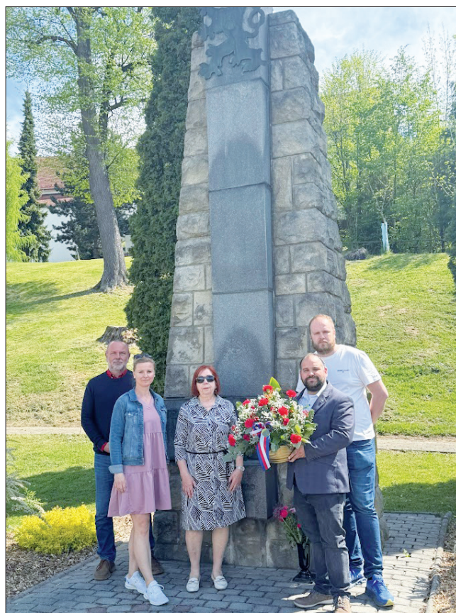
Vedení města Zubří si připomnělo 81. výročí ukončení druhé světové války a pietním aktem a položením kytice uctilo památku obětí obou světových válek.