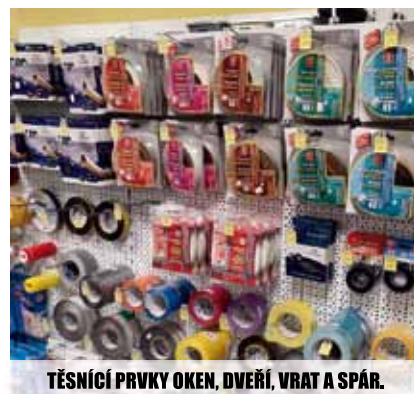
TĚSNÍCÍ PRVKY OKEN, DVEŘÍ, VRAT A SPÁR.

NEUSTÁLE ROZŠIŘUJEME NAŠI ŠIROKOU NABÍDKU ZBOŽÍ. NAVŠTIVTE NÁŠ OBCHOD!