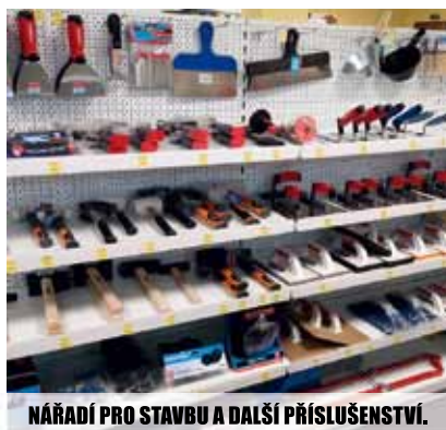
NÁŘADÍ PRO STAVBU A DALŠÍ PŘÍSLUŠENSTVÍ.