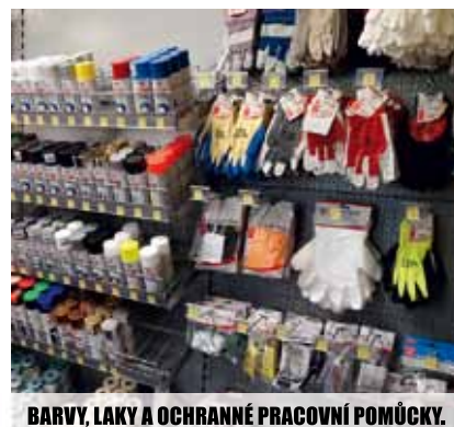
BARVY, LAKY A OCHRANNÉ PRACOVNÍ POMŮCKY.