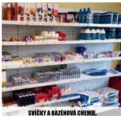
SVÍČKY A BAZÉNOVÁ CHEMIE.