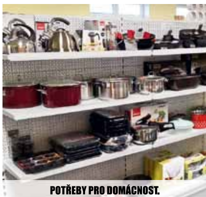
POTŘEBY PRO DOMÁCNOST.