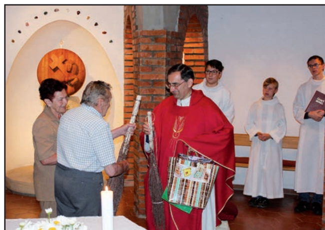
Rozloučení v kapli Svatého Ducha při mši svaté 6. července 2016.