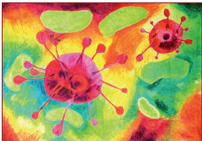
Věda, která léčí - Bohdan Mizera, 9.A

47 prací žáků 7. – 9. roč. Vyhodnocení proběhne tradičně 2. 12. v Arcibiskupském paláci po stonožkové mši.