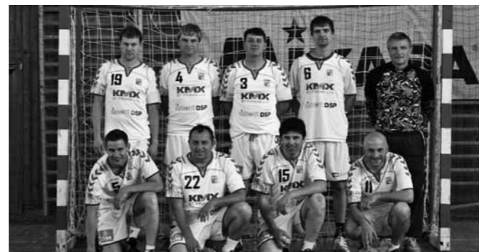
Vítězné družstvo v Novém městě nad Váhom

V boji o 3. místo: Michalovce - Zubří 11 : 6