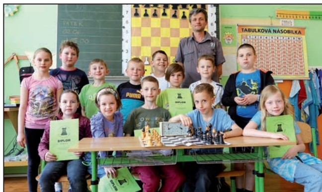
Závěrečná hodina školního šachového kroužku Přeji všem krásné a pohodové léto.

Závěr školního šachového kroužku, který připadl na 30. květen, byl již tradičně ve znamení předávání absolventských diplomů a drobných sladkostí na rozloučenou.