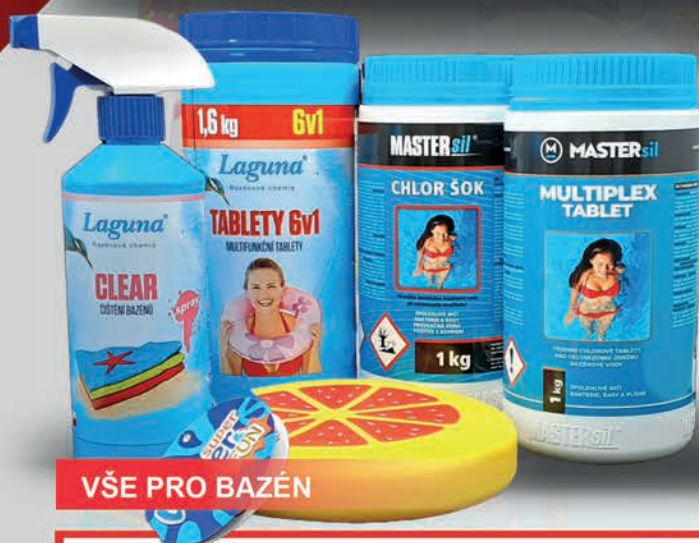
VŠE PRO BAZÉN