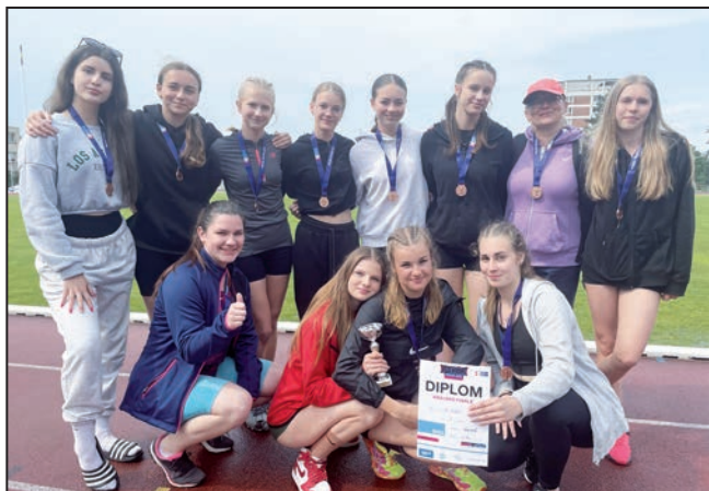
Pohár rozhlasu - krajské kolo Zlín - družstvo starších žákyní - 3. místo