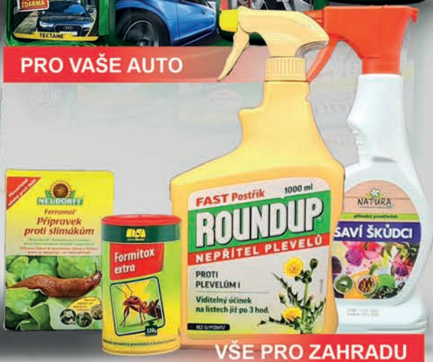
VŠE PRO ZAHRADU

🏠 PO - PÁ 7:00 - 17:00 SO 8:00 - 12:00 📍 U DOMOVINY 64, ZUBŘÍ 📞 +420 777 777 767