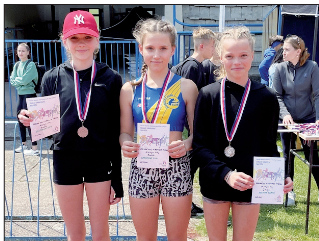
Nejlepší čtyřbojařky Zlínského kraje - ml. žákyně

Krajské kolo proběhlo v pátek 26. května 2023 na atletickém stadionu v Otrokovicích. Za krásného slunečného počasí zuberskou školu reprezentovalo 10 atletů 2 družstev (mladší žákyně a starší žáci). Družstvo starších žáků se ziskem 6 772 b. umístilo na 6. místě. Mladší žákyně jely do Otrokovic bojovat o 2. nebo 3. příčku. Ale mezi nejlepšími družstvy Zlínského kraje a zejména mezi školami s atletickým zaměřením se zuberská děvčata neztratila a naopak možná všem vytřela zrak.