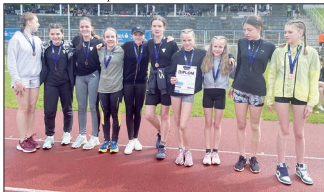
Pohár rozhlasu - krajské kolo Zlín - družstvo mladších žáků - 3. místo

Do krajského kola Poháru rozhlasu, které proběhlo na atletickém stadionu ve Zlíně v úterý 23. května 2023, postoupila obě vítězná družstva – mladší žáci a žákyně a družstvo starších žáků z 2. místa. Atletky ze Zubří se nenechaly zahanbit mezi atletickými školami. Obě družstva děvčat (mladší žákyně – 4 661 b., starší žákyně – 5 714 b.) svými skvělými sportovními výkony získala bronzové medaile a umístila se tak na skvělém 3. místě ve Zlínském kraji . Družstvo mladších žáků obsadilo pěkně 4. místo.