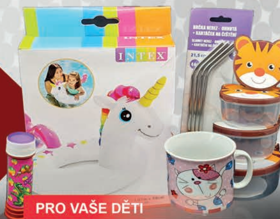
PRO VAŠE DĚTI