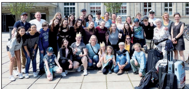
Společná fotka při loučení