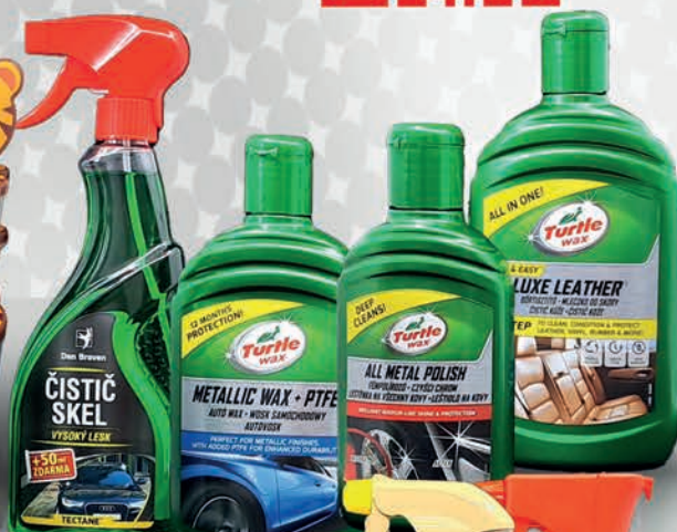
PRO VAŠE AUTO