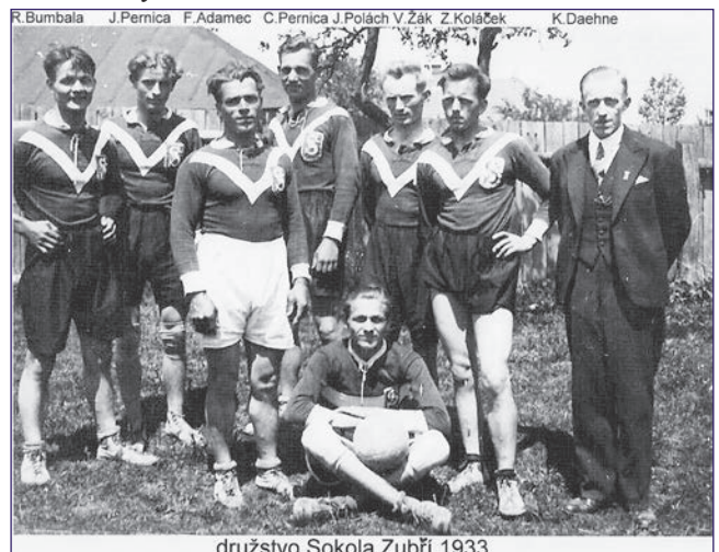
družstvo Sokola Zubří 1933

Mužstvo Sokola Zubří pak absolvovalo svá utkání na hřišti u sokolovny.