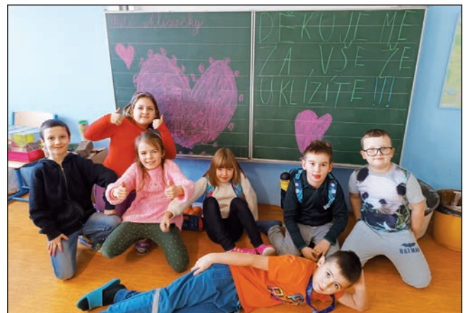
Vaši uklídomilové i nepořádníci (s velkou šancí na polepšení)