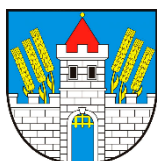
Město Klášterec nad Ohří